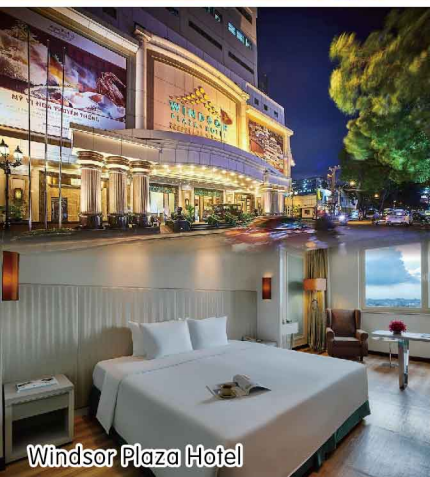
Windsor Plaza Hotel