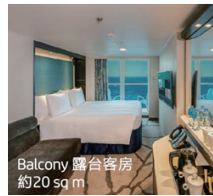
Balcony 露台客房 約20 sq m