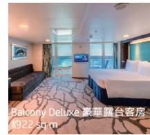
Balcony Deluxe 豪華露台客房 約22 sq m