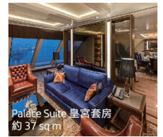
Palate Suite 皇宮套房 約37 sq m